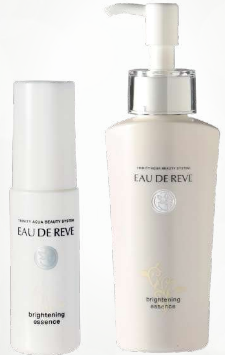
オードゥリーベ ブライトニングエッセンス