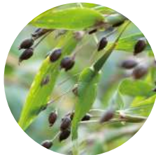
<ハトムギ種子エキス>