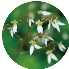
<ユキノシタエキス>