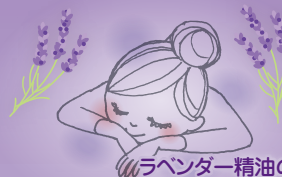
ラベンダー精油のリフレッシュアロマの香り

*2 アラリアエスクレンタエキス、カミツレ花エキス、アーチチョーク葉エキス、ヒアルロン酸 Na