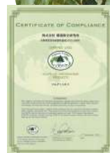
ECOFIT認定書 (ツルグミエキス)