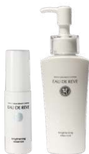
<オードリーベ> スキンケアローション 35mL ¥5,500 (税込) 120mL ¥13,200 (税込)

4種類のプライトニング保湿成分と浸透*滞在型WビタミンC誘導体を新たに配合。保湿成分が乾燥を防ぎ、明るく透明感のあるお肌へ導きます。石油系界面活性剤フリー、エタノールフリーなど全9種類のフリー処方でお肌をやさしい美容液です。