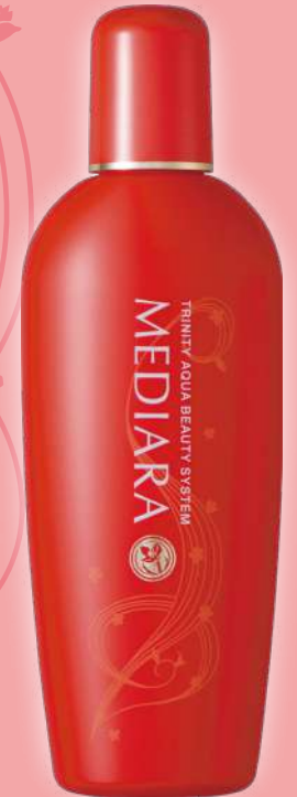
女性用スカルプローション 「メディエーラ」